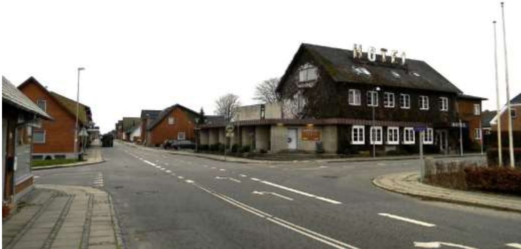
Et kig gennem Danmarksgade