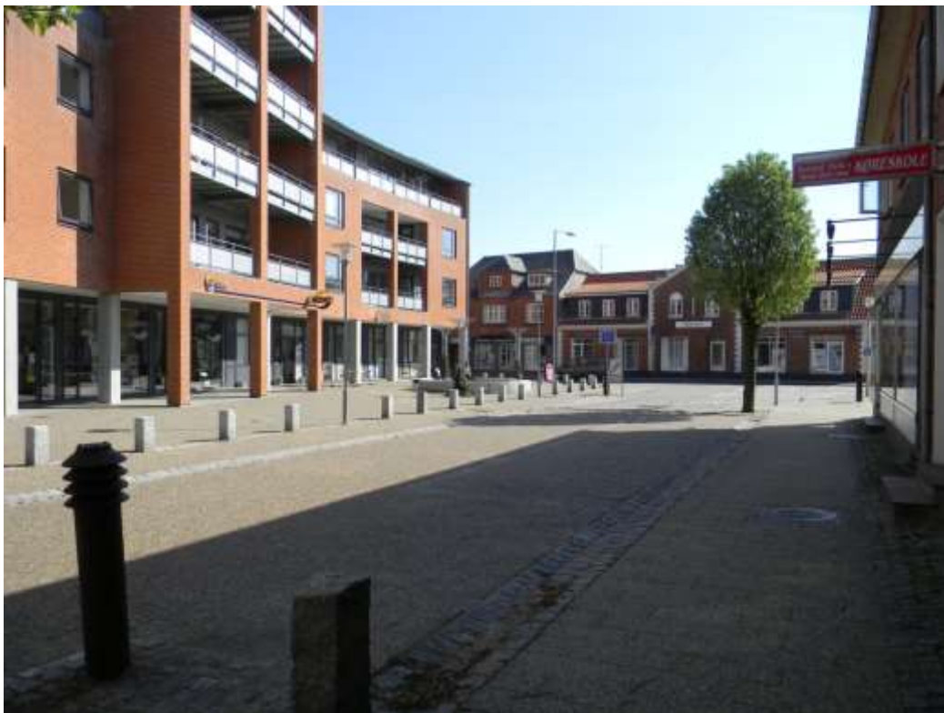
Bytorvet – for ende af Danmarksgade