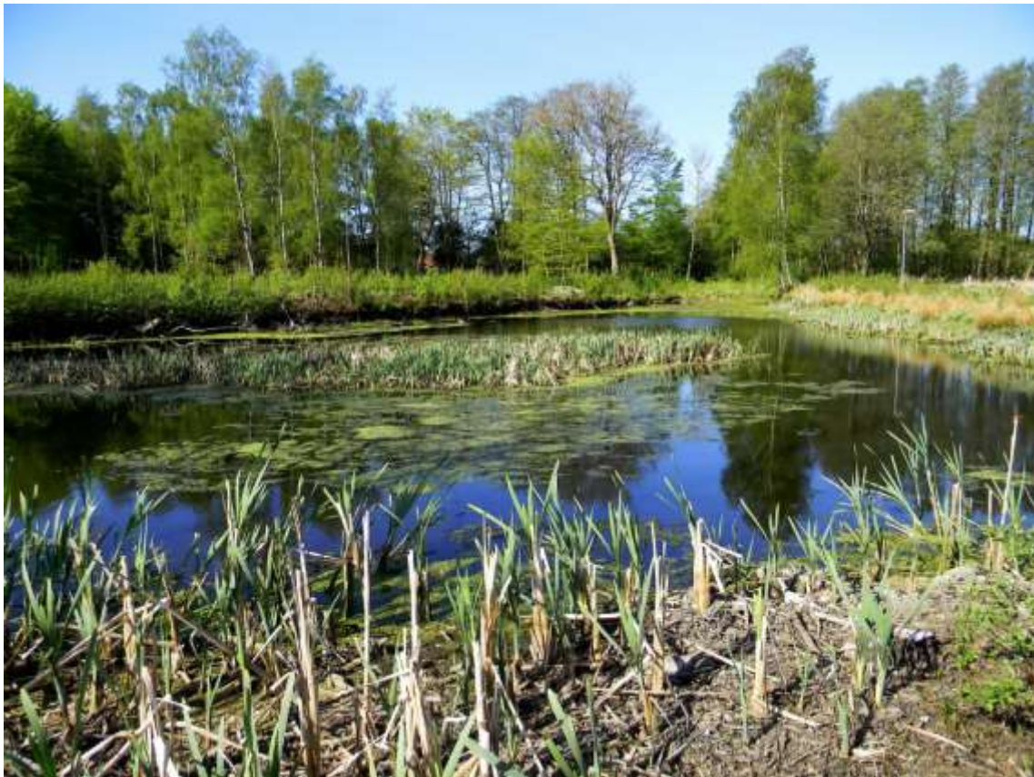
Andedam ved Lystanlæg