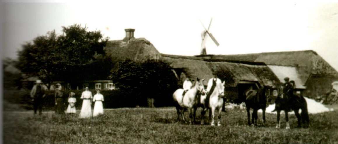
ILLUSTRATIONER: Side 6: Tegning af vindmøller på Thyholm ("Danmarks Land" Forlaget FREM ca. 1900). Stokmølle på Østerklit, Tversted (foto: Benny Christensen). Tegning af stokmøllen i Tversted (Arkitekt Peter Carstens). Side 7: Prisliste fra ca. 1900 (Egnehistorisk Arkiv for Thyholm og Jegindø). Stokmølle på Sønderriis, Venø (Privatfoto, Chr. Østergaard Jensen). Stokmølle på gården "Øster Toft", Holmsland ca. 1910. (Privatfoto, Erik Møller, Vester Tim)

18 af dem var fra Thyholm, 23 af hans møller stod i Salling, 7 i Thy, 7 i området syd for Limfjorden, 7 andre steder i Sjælland, 4 på Langeland, 1 på Sjælland og 1 på Sejerø. Teksten på forsiden antyder, at prislisten er fra perioden efter 1900, hvor støkmøllerne var trængt på markedet af de nye industrielt fremstillede "vindmotorer".