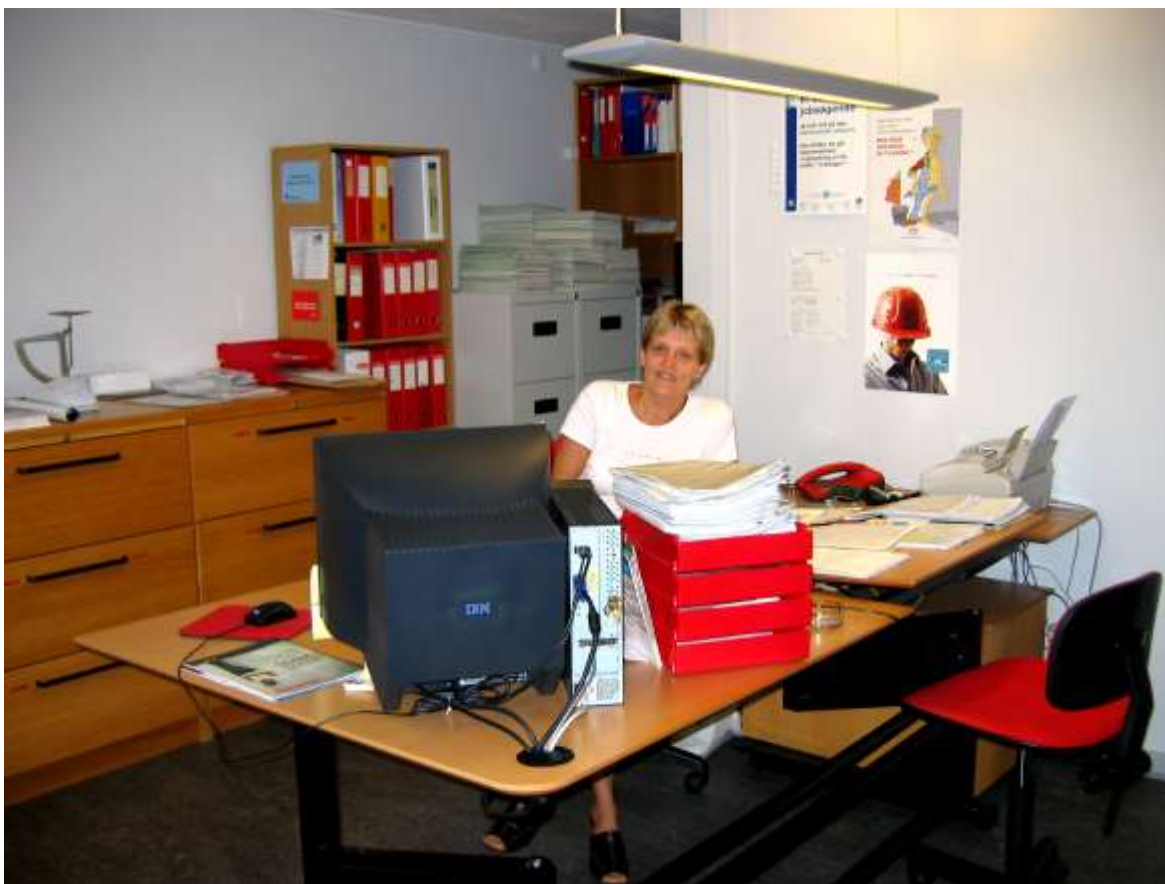
Varme emner debatteres gerne