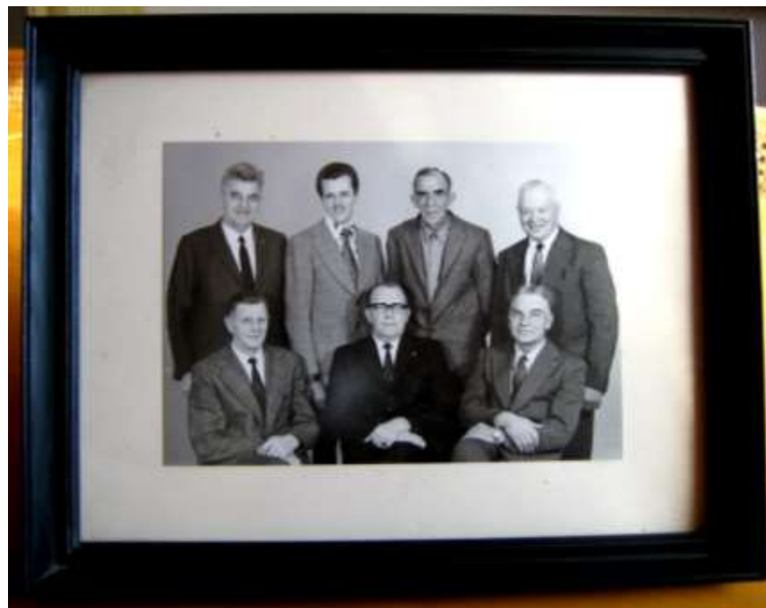
Foto i mødelokalets vindueskarm