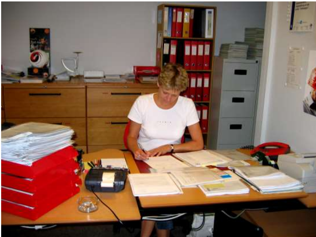
Lotte ved daglige gøremål