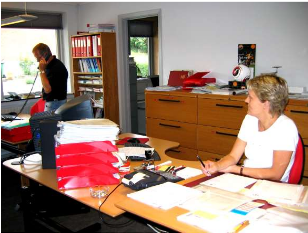
Der snakkes, lyttes og diskuteres om tingene