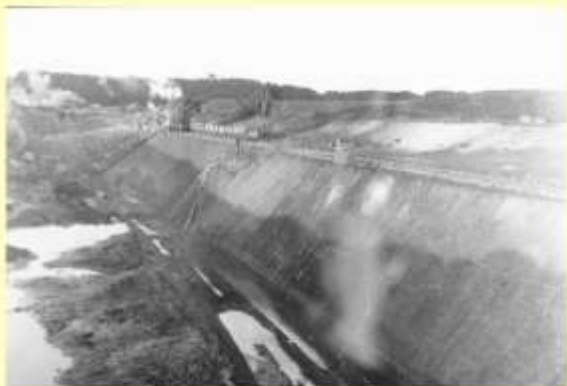
Mergellejet ved Tvis Kloster Mølle, med Theuts materiel og to gravemaskiner.