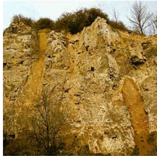
Mergel – ler blandet med kalk.

fællesgrave med industrialiseret organisering af opgravning, transport og salg.