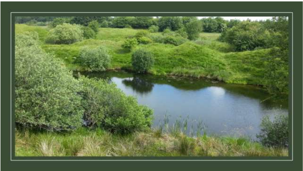
Det kuperede område, hvor der blev gravet ler i store mængder i årene 1928 - 1960

En overgang var det en meget stor arbejdsplads, hvor 60 – 70 var beskæftiget med arbejdet. specielt i 1930'erne var det en industriel arbejdsplads, som Tvis og Omegns Mergelselskab stod bag med arbejdet udliciteret til en storentreprenør. Det var et stort og tungt arbejde at grave leret op, men også distribueringen gav store udfordringer.